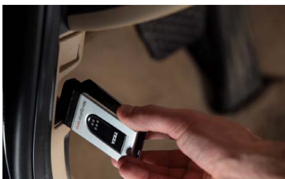
ナビゲータ・ナノをOBDソケットに差し込みます。

AXONE 4 は、NAVIGATOR NANO (ナビゲータ・ナノ) をインターフェースとしてブルートゥースによりワイヤレスで通信する最新型の診断機です。